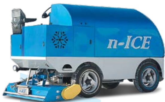
Айс-машина (льдоуборочная машина)

В процессе эксплуатации льда (особенно уличного) часто возникают такие проблемы, как уборка снега и ледяной стружки, устранение сколов, наплывов, трещин, ям на льду, необходимость полировки поверхности льда и т.п. Чистку ледового поля, заливку, поддержание его внешнего вида можно обеспечить как собственными силами, так и при помощи льдоуборочной машины (айс-машины). Мы поможем подобрать айс-машину именно для вашего катка и вашего бюджета.